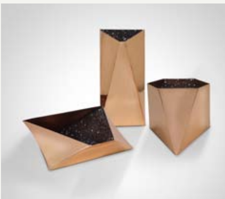
12— Star , David Adjaye, Galerie BSL, 2012.