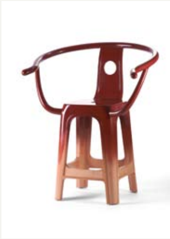
8— Loop , Pili Wu, ed. Yii Gallery, 2011.