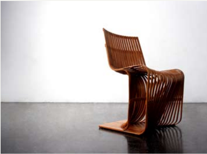
4— Chair 43 , Konstantin Grcic & Chen Kao- Ming, ed. Yii, 2011.