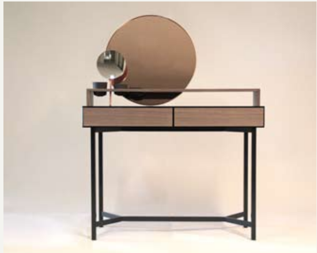
11— Oranatu , De intuïtiefabriek, ed. Priveekollektie Contemporary Art, 2012.