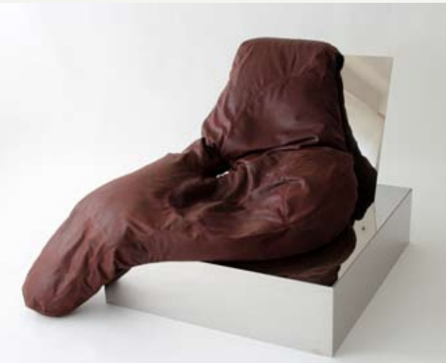
10— Picaro chair , Miguel Coates, ed. Priveekollektie Contemporary Art, 2012.