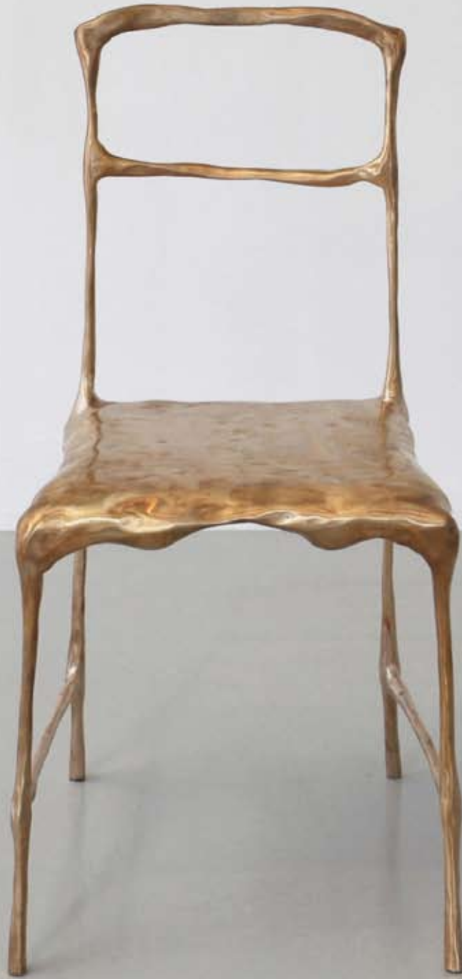
20 — Recession Chair , Frank Tjepkema, ed. Vivid Gallery, 2011.