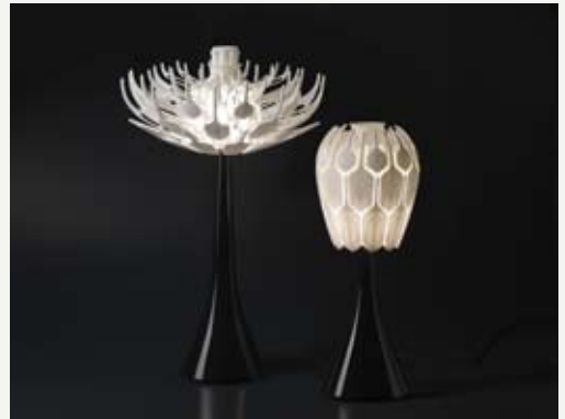
5— Bloom lamp , Patrick Jouin, ed. Materialise.MGX, 2010.