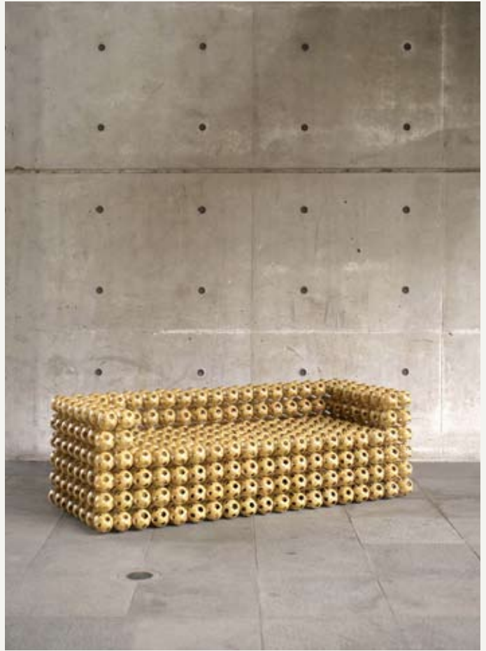
9— Bubble Sofa , Kevin Yu-jui Chou & Su-Jen Su, ed. Yii, 2011. © Courtesy Yii Gallery Photo: William Chen